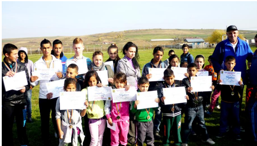
Crosul Bobocilor (în colaborare cu Direcția Județeană de Tineret și Sport Vaslui)