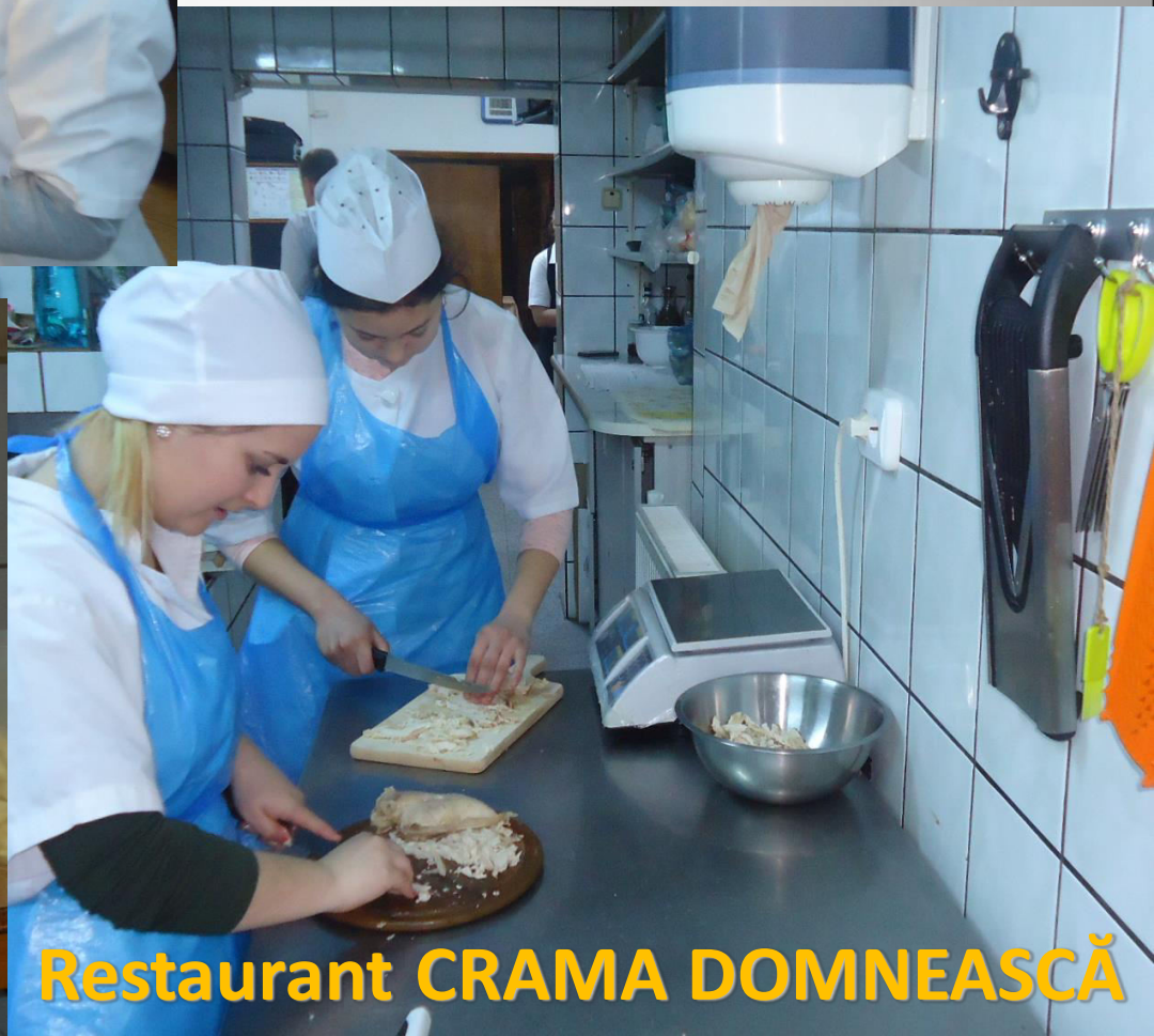
Restaurant CRAMA DOMNEASCĂ